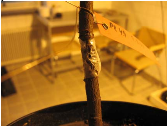
Bild 1. Kräftsår under parafilm.

Infektion av växtmaterial skedde genom att inokulera mycelfragment från renkultur på agar till snittade stjälkar och återförsluta dem med hjälp av parafilm, se bild 1.