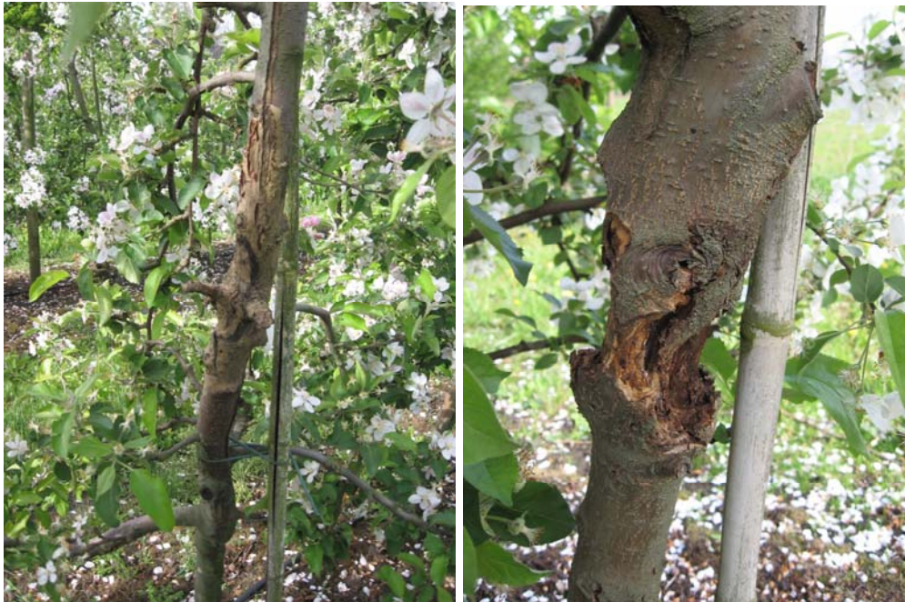
Bild 5. Till vänster lyckad behandling av omfattande rötter. Till höger obehandlat kräftsår.

Under 2006 utförde Mats Kron renskärningar av rötter och behandlingar med olika pastaformuleringar på äppleträd vid olika tidpunkter i en fruktodling i Norrvidinge. Dessa behandlingar följdes upp med en olulärbesiktning som utfördes av Guy Svedelius och Mats Kron den 15.5.07. Resultatet av den besiktningen framgår av tabell 3 och 4 och infogade bilder.