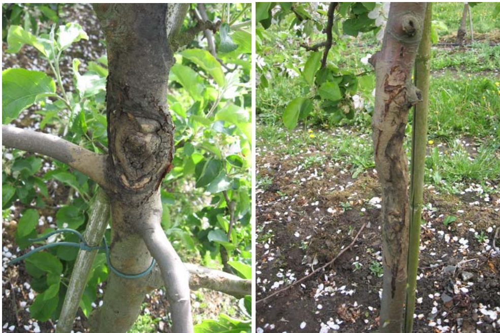
Bild 6. Exempel på godartad kallustillväxt efter beskärning och behandling.