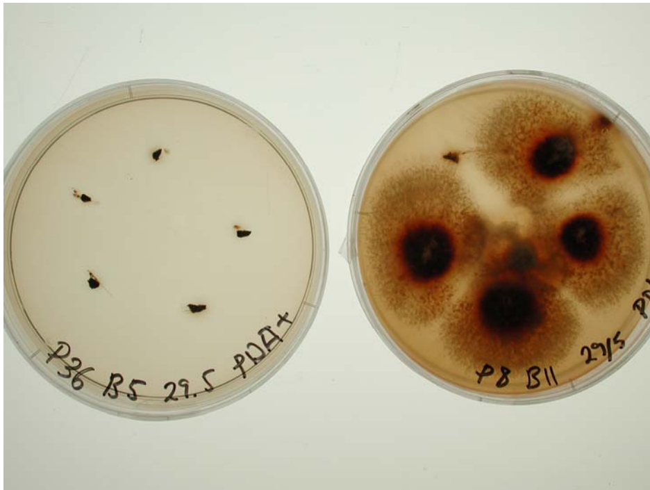
Bild 4. Överlevnadskontroll i agarskålar, 5 vävnadsbitar per skål. Vänster ingen utväxt, höger 4 av 5 utväxt.

I några skålar var återväxten ej fullständig vilket beror på skillnader i behandlingseffekt och/eller svampetablering i träden.