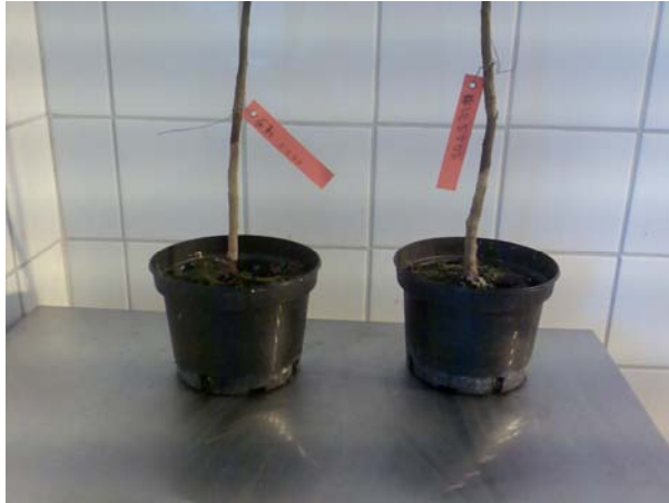
Bild 2. Pastabehandling av kräftsår på pärongrundstammar.

Pastorna är modifieringar av den ursprungliga tomatpastan Scania Vitalis Silica avsedda för fruktodlingar samt en marknadsförd produkt Lac-Balsam. Dessa behandlingar fick verka i ca 3 veckor.